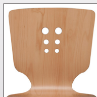
Schale Typ H