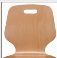
Schale Typ C mit Griffloch