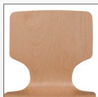
Schale Typ B