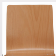
Schale Typ K