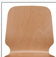
Schale Typ A