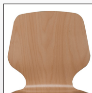
Schale Typ C