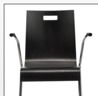
Schale mit Griffloch