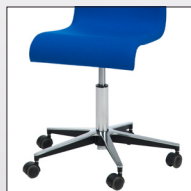
Drehstuhl mit Rollen