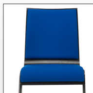
Sitz- und Rückenpolster