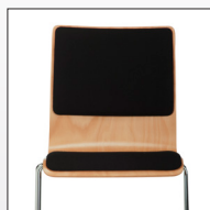
Sitz- und Rückenpolster