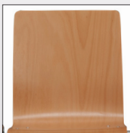
Schale Typ K