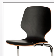
Beidseitig mit Kunstharz belegt