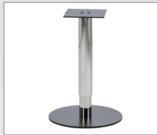
Untergestell mit Höhenverstellung 660 – 1090 mm, 1-fach-Teleskop

Produktblatt und Preisliste | Alle Preise in CHF, inkl. MwSt., gültig ab 01.03.2017 | Preisänderungen und Irrtümer vorbehalten.