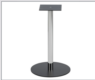
Untergestell mit fixer Höhe